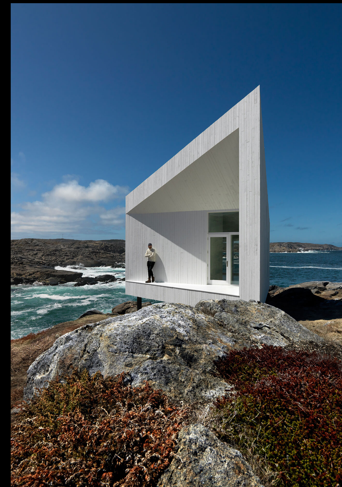
Studio's – Newfoundland