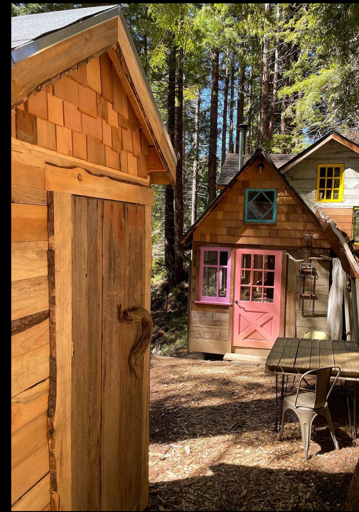
Salmon Creek Farm – Albion