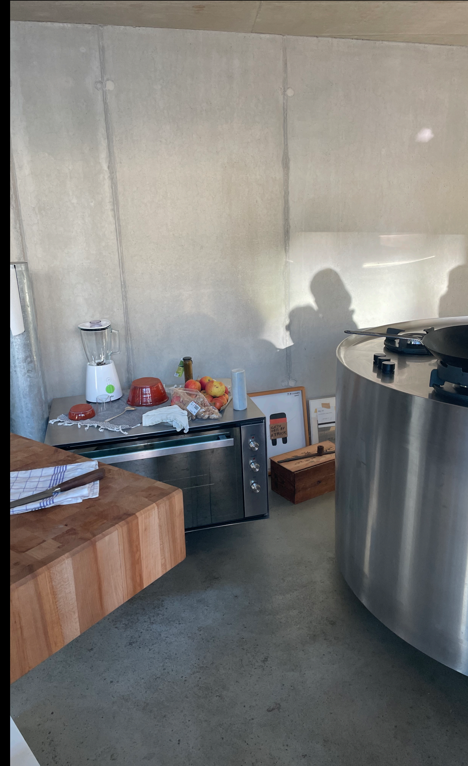
Apartment Complex – Sam Chermayeff Office