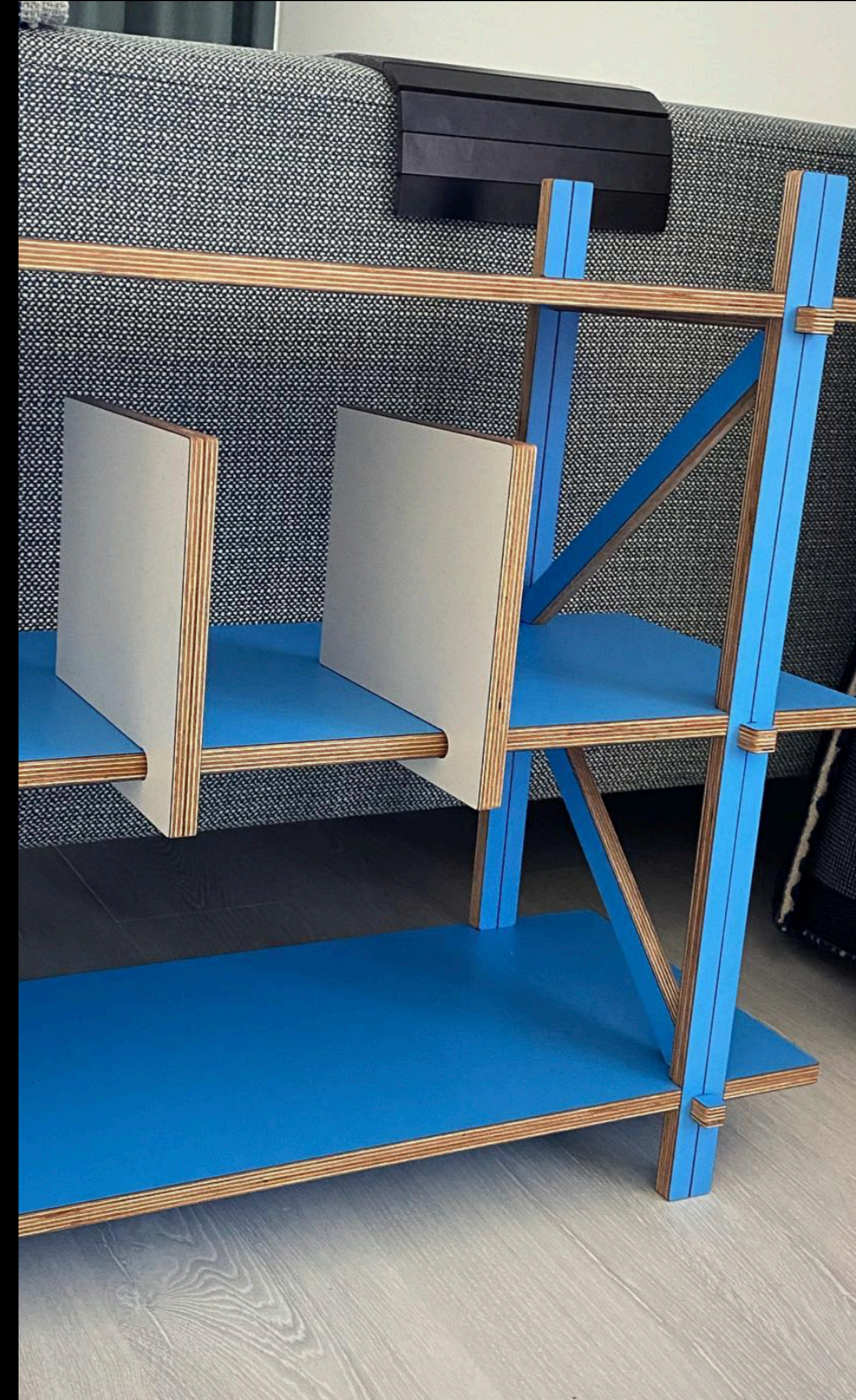
Kilo Furniture – Amsterdam