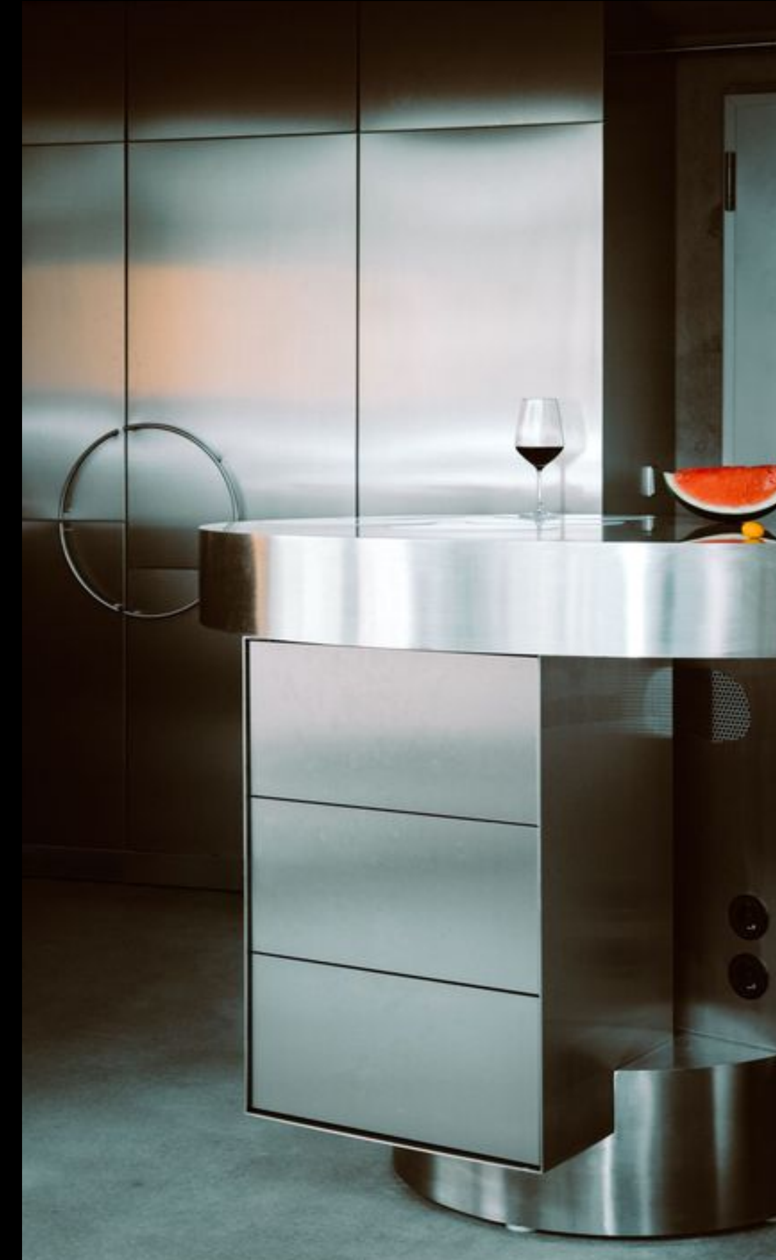
Apartment Complex – Sam Chermayeff Office