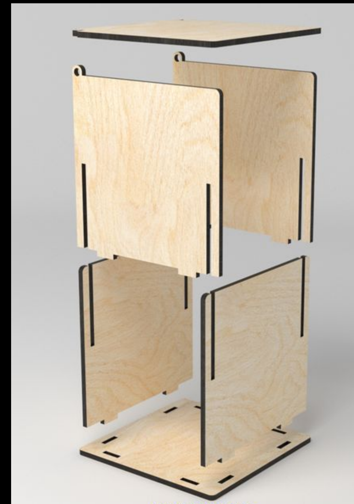
Eén-Voudige Materiaal Verbinding