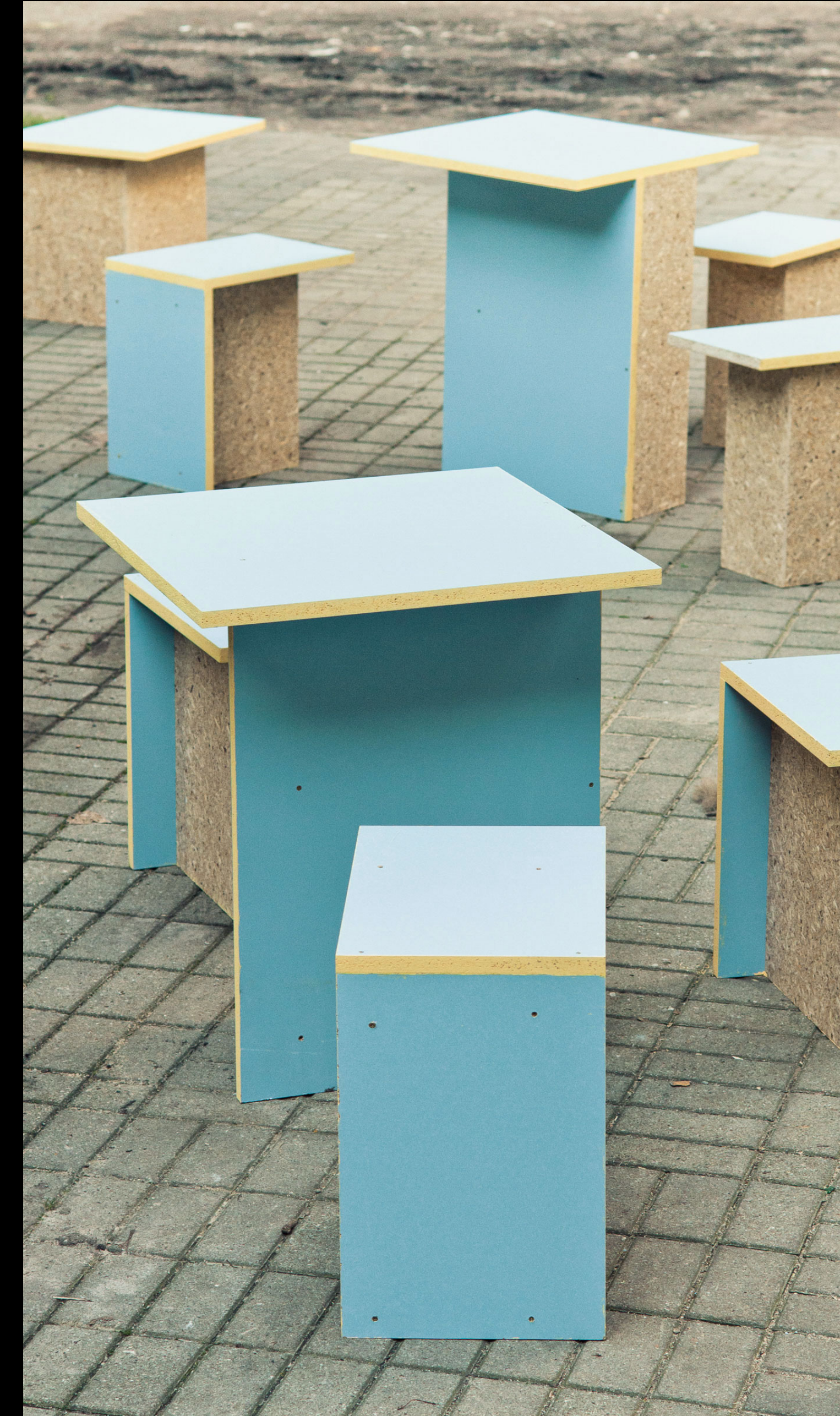
Moomin Valley — Studio Rygalik