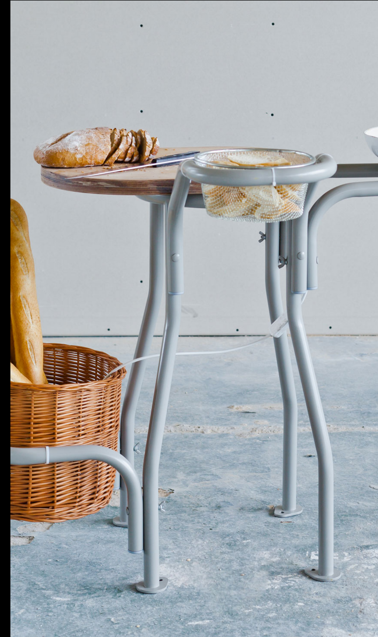
The Kitchen – Studio Rygalik