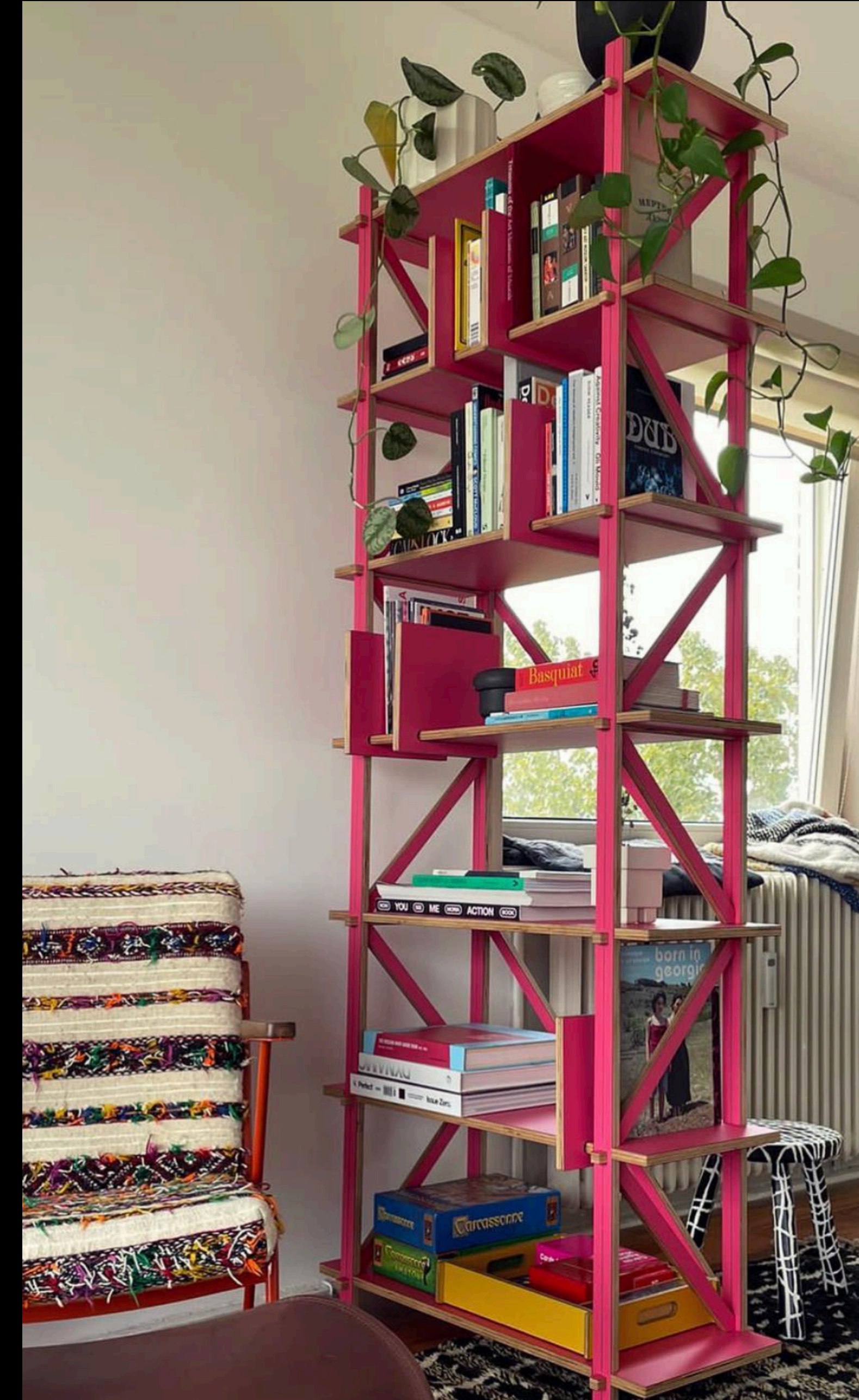
Kilo Furniture – Amsterdam