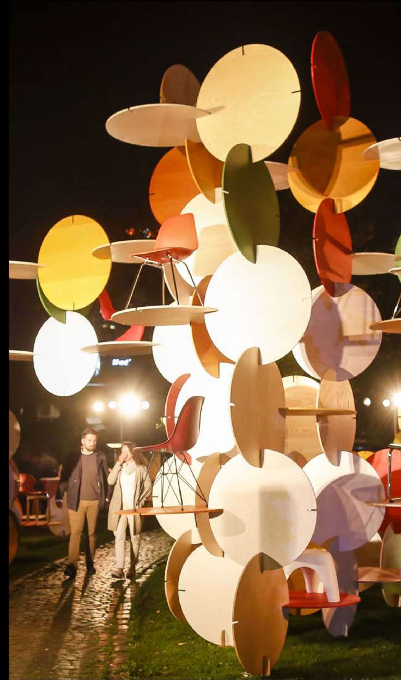
Vitra [dot] Festival – Studio Rygalik