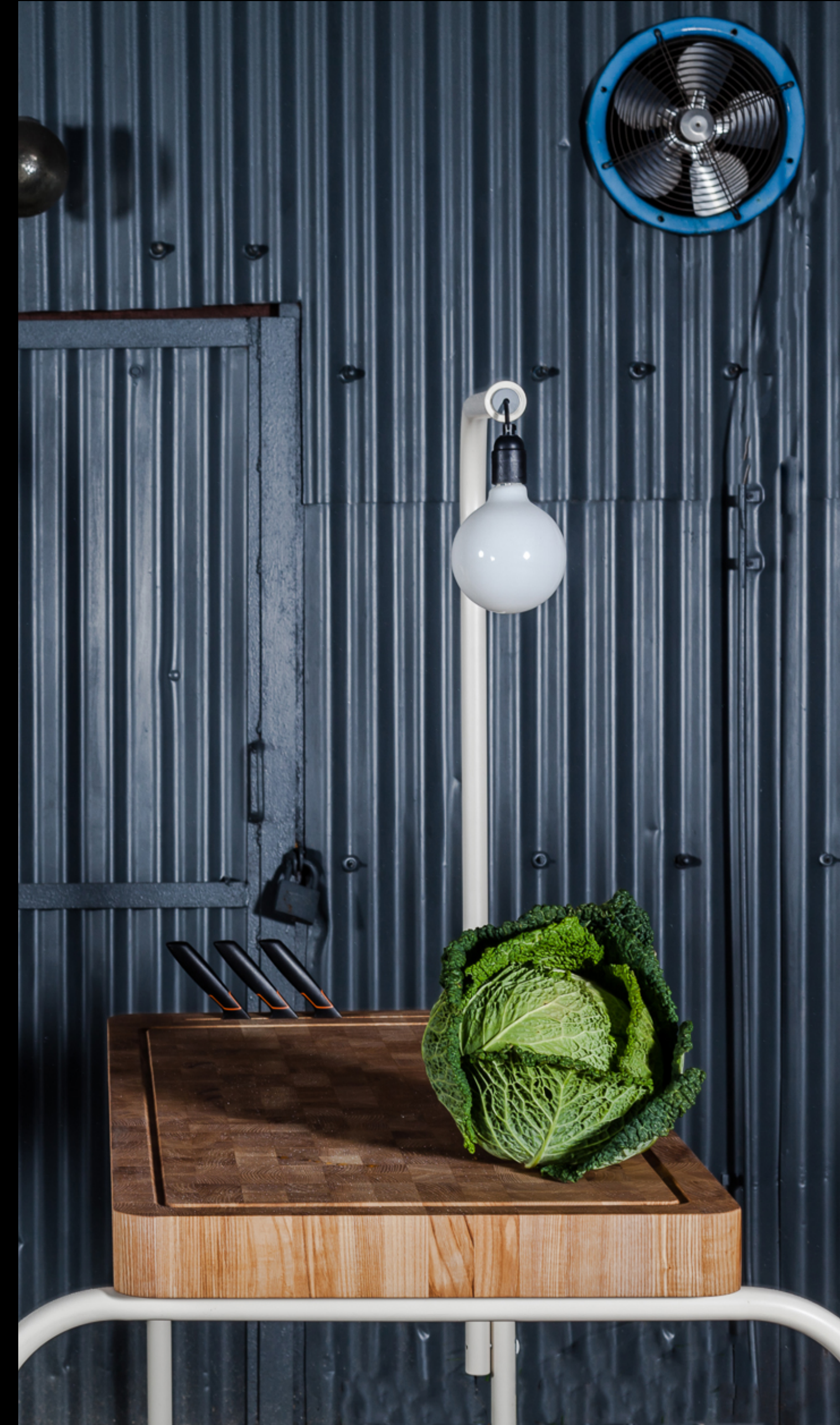
Siemens Foodlab I – Studio Rygalik